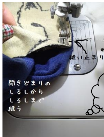
11、開きどまりと次の合印までとめたら 開きどまりから縫い始め、生地を引っ張りなが 反対側の開きどまりまでぬう →縫い代をアイロンで開く