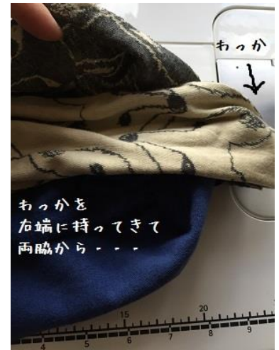
9、まだ縫い合わせてない方の開きどまりを 合わせます