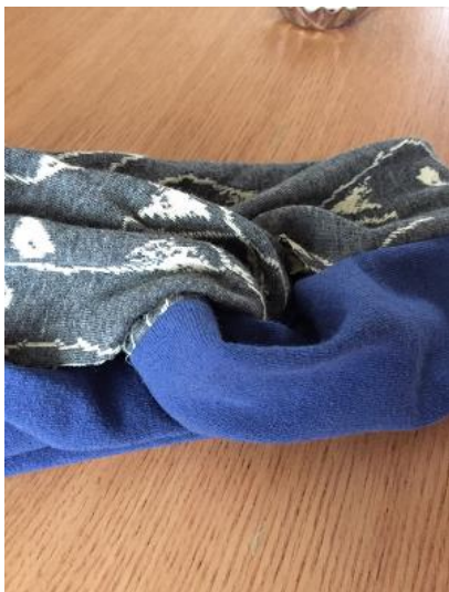
13、形が見えてきました