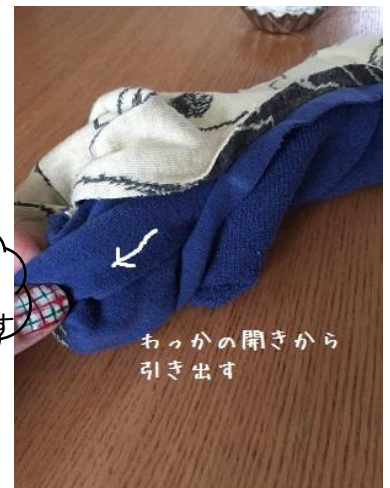
12、開きどまりのところから 全体を引っ張りだします