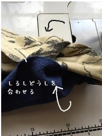
10、こんな感じ、ますますよくわからない形に なりますが・・・