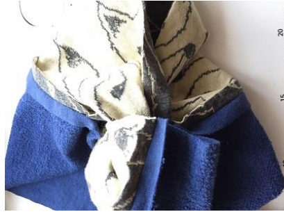
8、左右に開いて、今真ん中に見えている 開きどまり付近のごちゃとしたところ (わっか)を右端に持ってきて