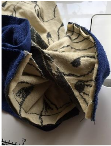
7、アイロンで開いたところ こんな感じです