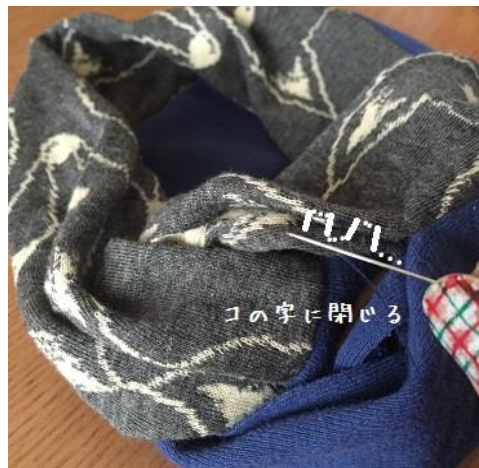
14、開きどまりのところをコの字で閉じます 2つあるので両方閉じます